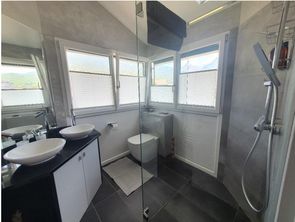
A proximité des chambres 2 douches à l'italienne avec 1 wc et 2 doubles vasques.