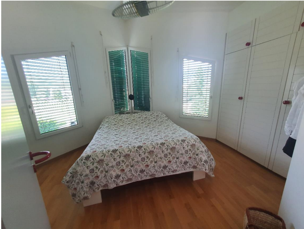
3 chambres à l'étage dont une avec armoire encastrée 3 portes.