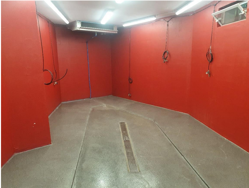
3 caves dont 2 climatisées alimentation d'eau chaude et froide.