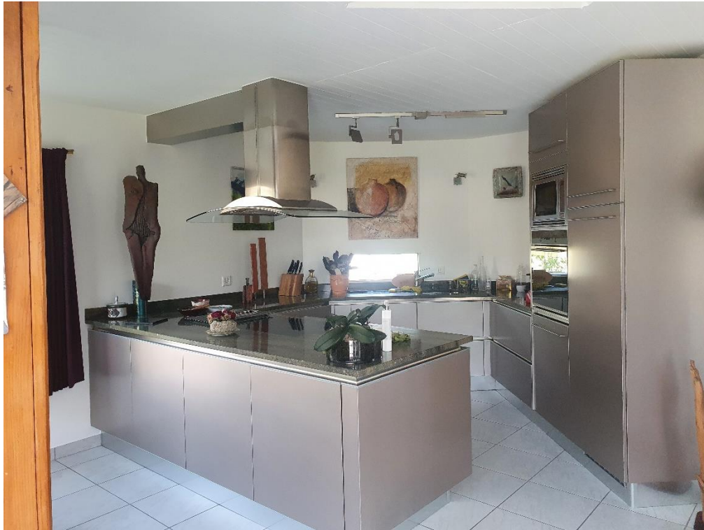
Au rez. Confortable espace de vie ouvert sur les extérieurs.