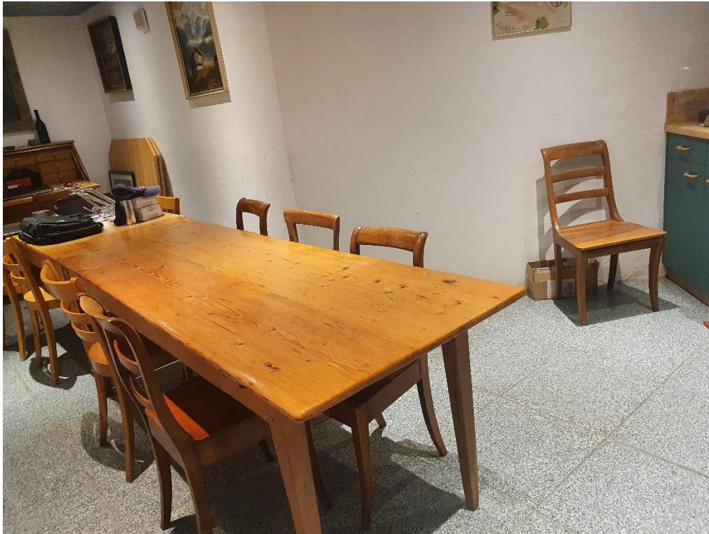
Au sous-sol carnotzet avec sa petite cuisine équipée.