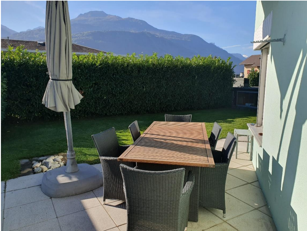
Terrasse avec son jacuzzi, pelouse et talus arborisé.